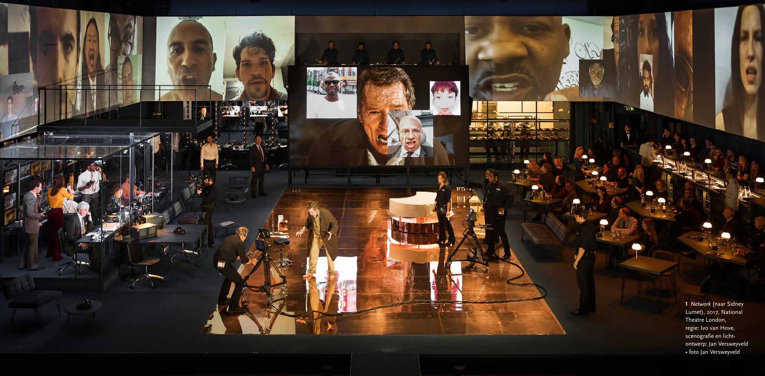
1 Network (naar Sidney Lumet), 2017, National Theatre London, regie: Ivo van Hove, scenografie en lichtontwerp: Jan Versweyveld